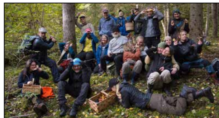
Skogsgruppen arbetar med skogsfrågor i länet.

Vi har en aktiv skogsgrupp i Örebro län. Det är cirka 15 personer i kärnan och ytterligare cirka 10 personer som deltar ibland. På mejllistan finns ca 50 personer totalt.