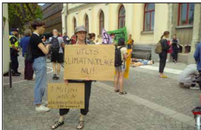
Klimatnätverket och Klimatfredag manifesterar för klimatet på Stortorget i Örebro.

Under hösten 2019 fick nätverket besök av flera lokala politiker för att diskutera klimatfrågor. I nätverket ingår bland annat Klimatfredag/fridaysforfuture Örebro. Vi har deltagit vid både globala klimatmanifestationer och de klimatfredagar som anordnats på Stortorget i Örebro.