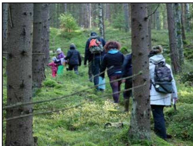
Ute i skogen i projektet "Grön i naturen – Språka mellan tallarna 2".