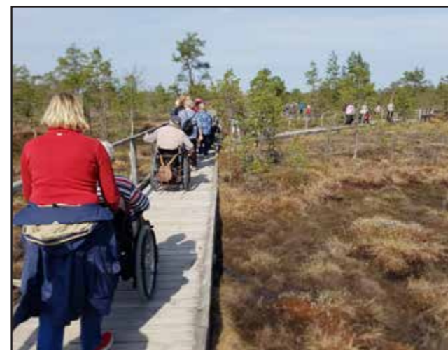
Hopajolas tillgänglighetsguidning i Knuthöjds mossen i Hällefors kommun.

Tillsammans med Länsstyrelsen ordnar Hopajola månadens reservatsguidning. Några teman under året har varit vinterfåglar, djurens spår, grön infrastruktur, invasiva arter, invigning av Meshattsbäcken, naturvårdsbränning & vattenvård med mera. Under året har Hopajola även anordnat sju tillgänglighetsguidningar i några av länets tillgängliggjorda naturreservat; Knuthöjds mossen, Trystorp, Herrfallsäng, Garphyttans, Fagertärn, Tiveden och Kvismaren. Guidningarna finansieras av Region Örebro län och genomförs i samarbete med bland annat DHR, Neuroförbundet, RTP och Synskadades Riksförbund Örebro län (SRF). Läs mer i Hopajolas årsberättelse.