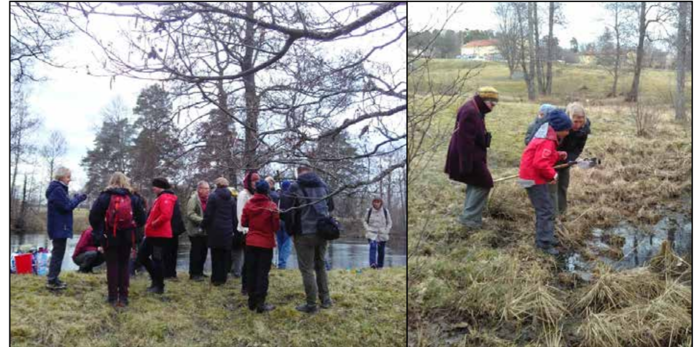
På håvande utflykt efter länsstämman i Vedeå i april.

En verksamhetskonferens för styrelse och anställda hölls 25–26 oktober i Järnboås bygdegård Finnsjöstrand. Dagarna ägnades åt frågor kring ökad samverkan mellan kretsarna och med länsförbundet, hur medlemsaktiviteten kan stimuleras och hur vi kan kanalisera folks klimatengagemang till föreningen. Tid ägnades även åt att summera verksamhetsåret samt att utifrån verksamhetsstrategin börja planera för kommande verksamhetsår.