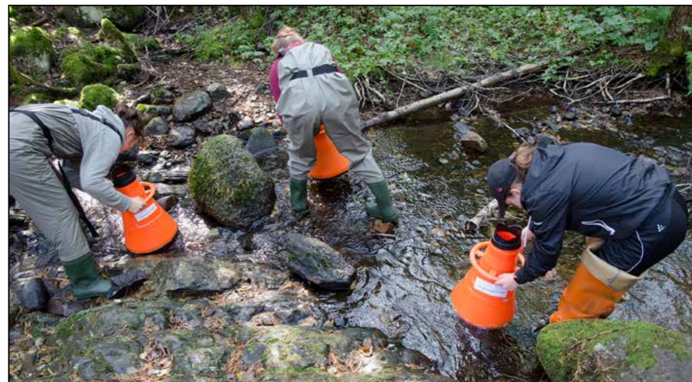
Gymnasieelever från Rudbecksgymnasiet tittar i vattenkikare på djur som lever i bäcken, i projektet "Lärande vatten".

Under 2019 har länsförbundet, tillsammans med övriga länsförbund runt Vättern, medverkat till en ny ansökan om medel från Riksförbundet för att miljöjuristen ska kunna fortsätta sitt arbete. Under 2019 har ytterligare ett miljöhot drabbat Vättern då försvarets planerade sanering vid flygplatsen i Karlsborg kommer att orsaka utsläpp av PFAS i sjön.