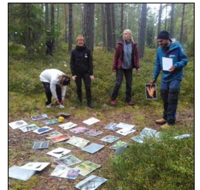
Guidekurs för naturvägledning på andra språk.

I anslutning till konferensen genomförde vi en två dagars-utbildning med deltagare från andra delar av landet och CNV. Det var en praktisk kurs med aktiviteter och guideövningar ute i naturen.