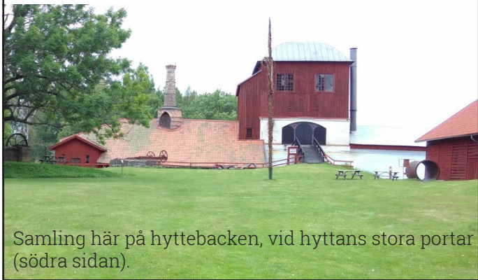
Samling här på hyttebacken, vid hyttans stora portar (södra sidan).

Gör din egen växtpress och lär dig känna igen några vanliga växter. För att minnas bättre skissar vi dessa och gör skulpturer i papper.