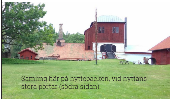
Samling här på hyttebacken, vid hyttans stora portar (södra sidan).